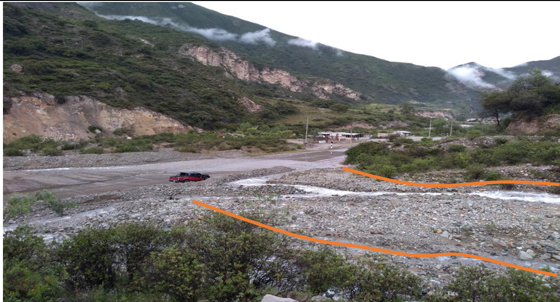
FIGURA N°01: Cauce en épocas de estiaje, tramo donde se propone defensa ribereña; Material a descolmatar en cauce de la quebrada.