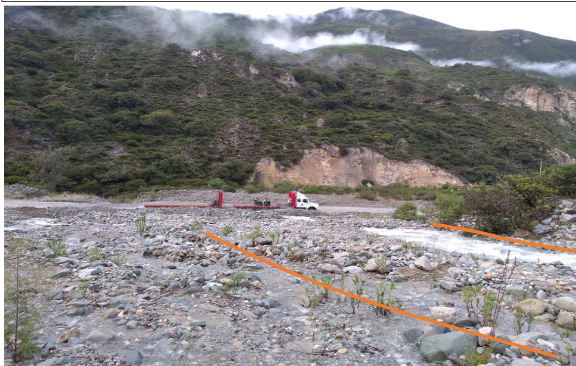
FIGURA N°02: Cauce en épocas de crecidas de la quebrada, tramo donde se propone defensa ribereña, se observa la vía al lado; flujo de agua por alcanzar la plataforma de rodadura de la vía asfaltada Abancay Chalhuanca.